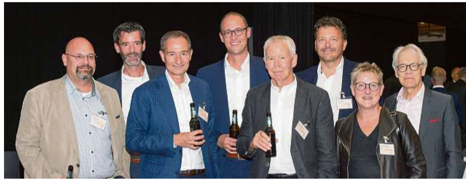
Stay safe: Geimpft. Getestet. Genesen - Covid-konformes Gruppenfoto am Wirtschaftsforum (v.l.)